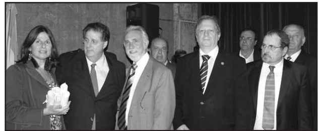
La entrega del Premio Anual 2011 contó con la destacada presencia del Ministro de Salud provincial, Dr. Alejandro Collia y su gabinete.